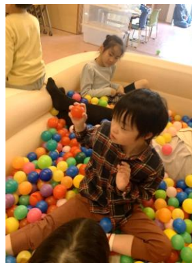
↑ 久しぶりのボールプール、楽しかったね♪