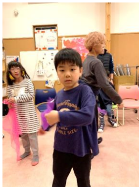
↑ リズムに乗って色々な活動を楽しみました♪