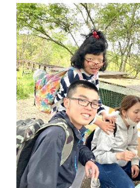
↑ 🐾 牛さんやお馬さんと触れ合いました 🐾