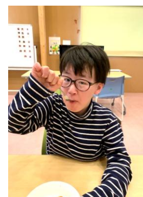
↑ 沢山お料理を作りました～