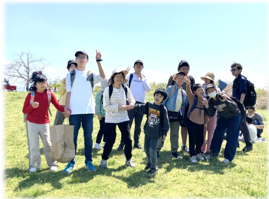
うまけんきゅうりょうこうえん い 馬見丘陵公園に行きました♪ 🌸 ippai お散歩をして綺麗なお花も見れたよ 🌸