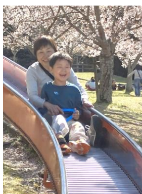
↑ ぼかぼか陽気でたくさんお出掛けをしたよ すべり台や鯉のエサあげなどいっぱい楽しみました。🌸