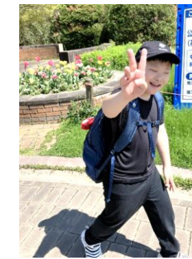
↑ 公園のお花がキレイだったね 🌸