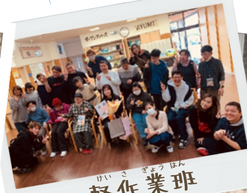
けい さ ぎょう はん 軽作業班