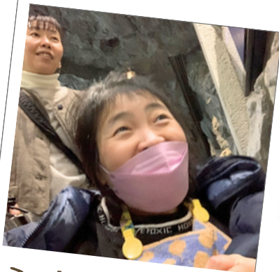
はん ふきのとう班