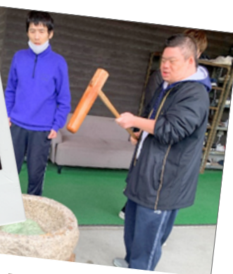
はん がじゅまる班