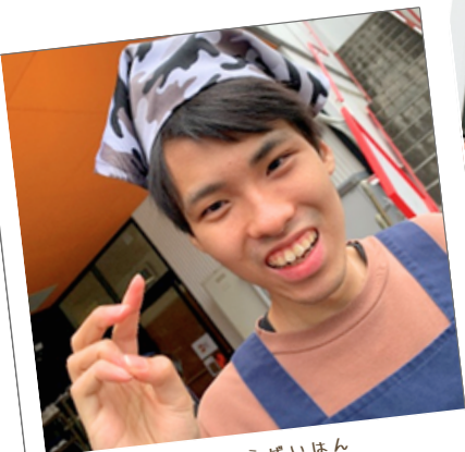
しゅこうげいはん 手工芸班