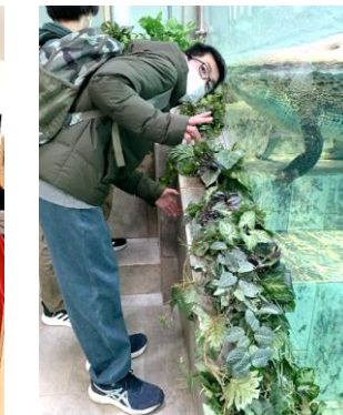
↑ 素敵な歌声にうっとり。感想もしっかり伝えました♪ 目の前にワニがいて大迫力だったね 🍷