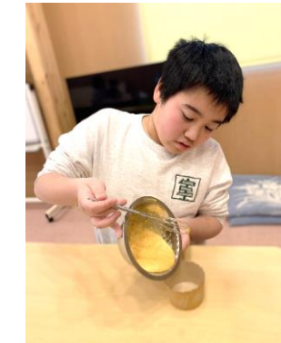
今月は米粉チーズ煎餅やケークサレなどに挑戦しました♪ 難しい工程もあったけど、美味しく出来上がりました 🍷