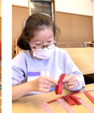
雛飾りにバレンタイン 🍷 季節の制作を楽しみました♪