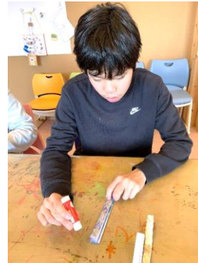
ハサミでチョキチョキ切ったり、 糊でペタペタ貼ったり、色々な作品を作ったよ 🍷