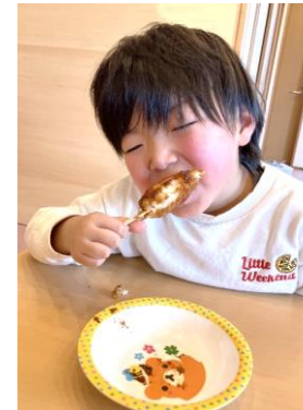
↑ 今年最初のクッキングは五平餅に挑戦したよ ↑ じゃが芋の子デミもモチモチで美味しかったね