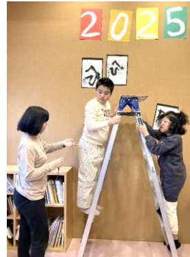
↑ 登るのは少し怖かったけど、頑張って飾りました!! ↑ 平城宮跡で凧あげに挑戦!!