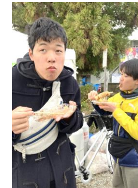
↑ 出店で買った「箸巻き」美味しかったね ↑ 真上をオットセイが泳いでいったよ