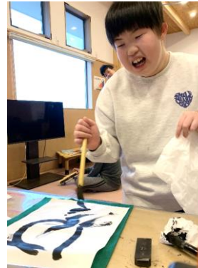
↑ 書初めに挑戦!! 上手に書きました。 ↑ 久しぶりのサーキットでたくさん運動をしたよ