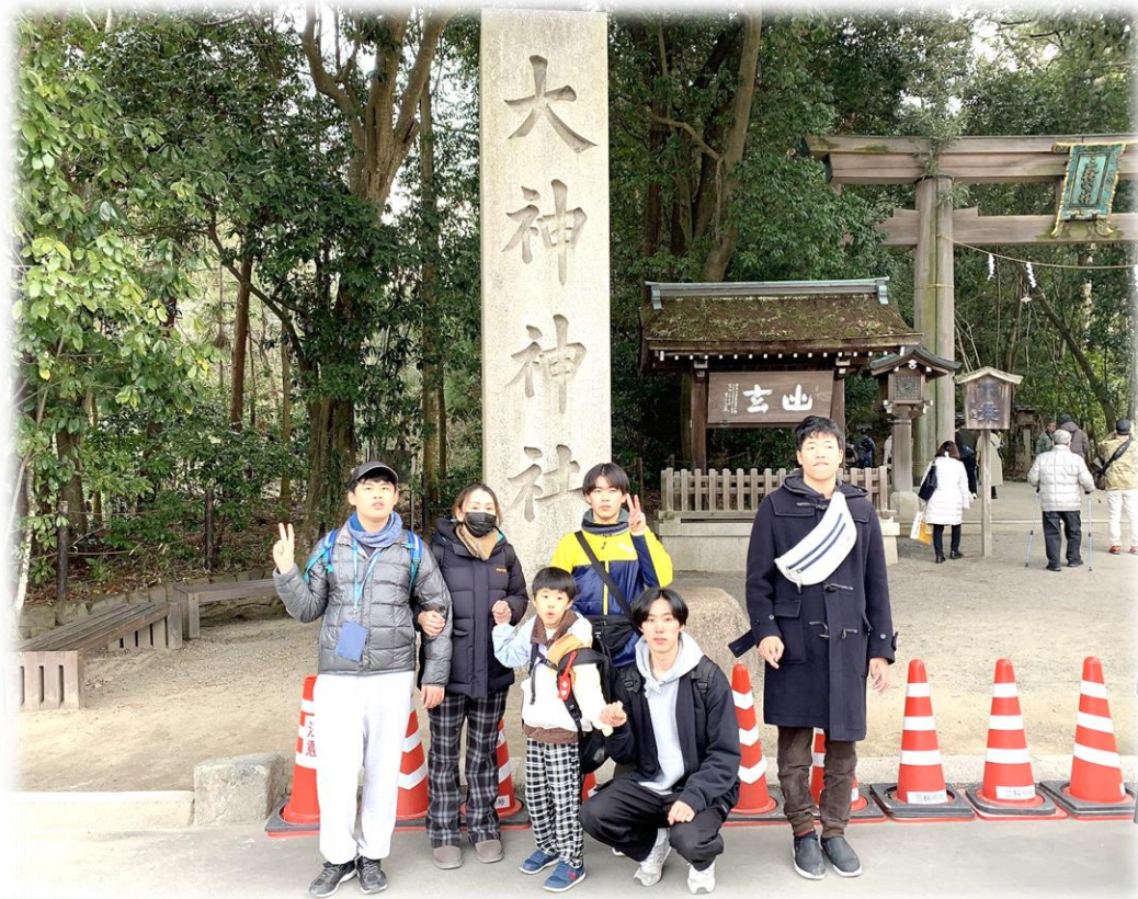
〇 大神神社へ初詣に行きました 〇 出店で食べ歩きもできて楽しかったね ♪