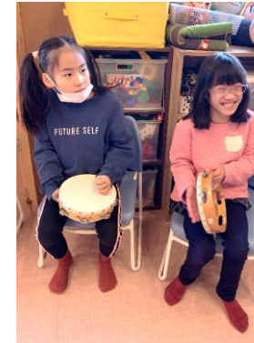
カラオケやリトミックで楽しく、にぎやかに新年をスタートしました