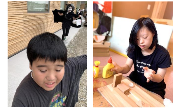
↑お化け接近中!! 全力ダッシュで逃げました。↑ 材料を貼り合わせて、大作が出来上がりました。