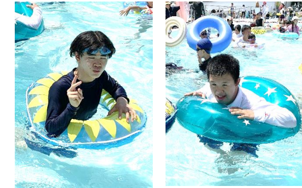
ファミリー公園前プールへ行ったよ。 スライダーもたくさん滑って気持ち良かったね。