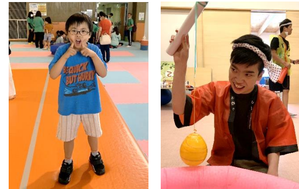
ドリーム21で元気に遊び、月末には納涼のあゆみ縁日を楽しみました。♪♪