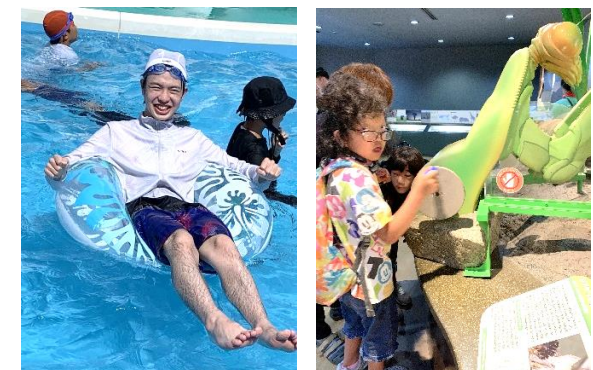
三郷のプールや昆虫館など、遠くまで遊びに行きました。