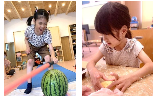
スイカにアイス、美味しいおやつをたくさん食べたね。