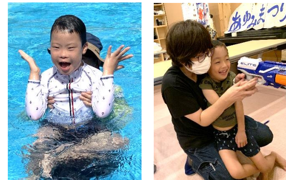
プールやお祭りなど、只今夏休み満喫中です。