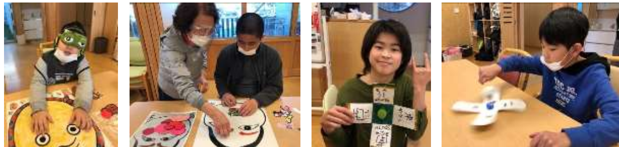
今月はプログラムで「福笑い」と「牛乳パック駒作り」をしたよ。牛乳パック駒は予想以上にうまく回って、トーナメント戦でコマ回し対決もしたよ!!盛り上がったね!