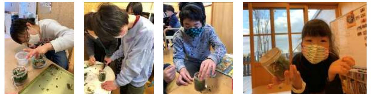
瓶の中に自然を作ろう!ということで、バークチップ、グリーンモス、動物、木などを順番に入れていき、森の中をイメージしながら作ったよ♪かわいい作品にニコリ☺お家で飾ってね!