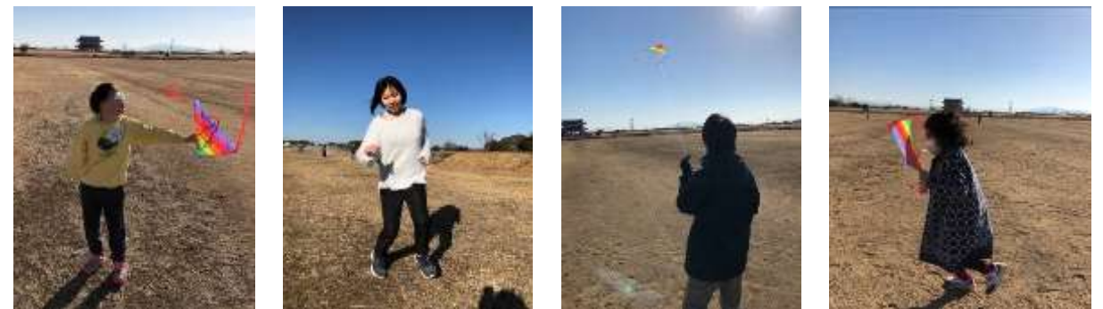
毎年恒例の風あげ!今年はお天気も良く、走ると暖かいぐらいの陽気でした。 風も程よくあがったよ!かけっこ&お散歩も楽しめました(*^^*)