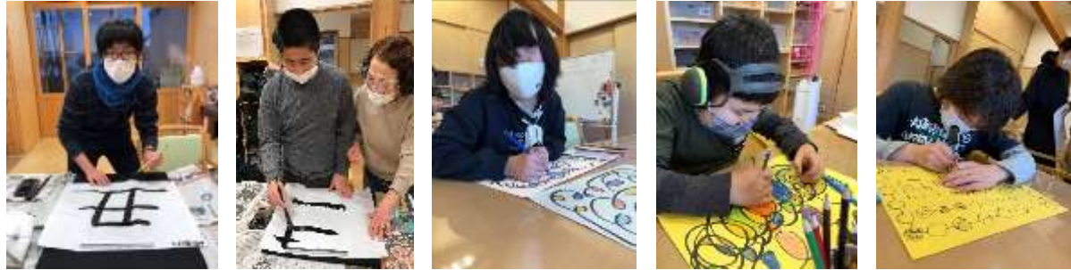
今月は書初め、模様遊び、ダンボール工作(鬼づくり)。書初めは自分の好きな言葉を書いたよ! ダンボール工作は一人で作った人や、お友だちと共同で一つの作品を作った人もいたよ♪