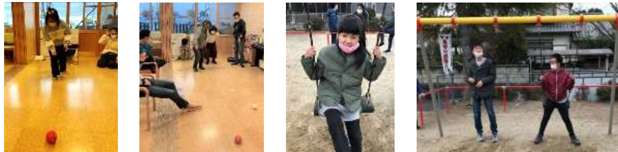
ポッチャ対決 奈良チームv s 京都チーム。今月はいつも勝利していた京都チームがまさかの連敗?!悔しい思いをした京都チーム、来月はリベンジなるか?! 少し暖かい日はお散歩 & 公園へ。久しぶりのブランコ、楽しかったね!