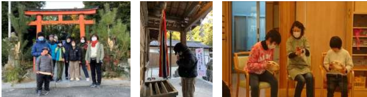
秋篠寺のお隣の八所御霊神社へお詣りに行ったよ! 神社の手水舎に氷が張っていて、みんな大喜び♪冷たい氷を手にとって遊んでいました。 室内での楽器演奏、施設横の芝生広場での綱引きも楽しかったね!