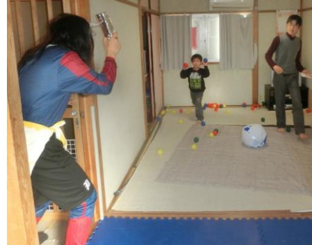
2月3日は節分! 皆でオニのお面を作りました♪お面を作って見せあった後は