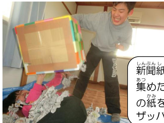
新聞紙遊び☆ 集めたたくさんの紙を友だちにザッバーン!