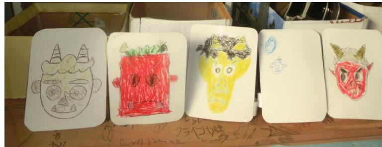
たくさんのおニのお面ができたね♪