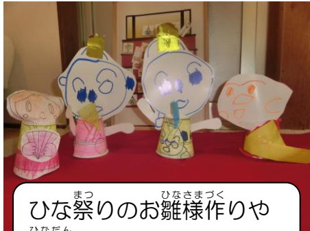
ひな祭りのお雛様作りや 雛壇パズルをしました。