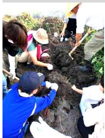
掘って掘ってまた掘って