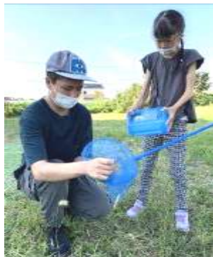
ふたり 二人で虫ゲットなるか!?