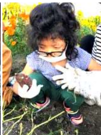
こんな芋出ました!