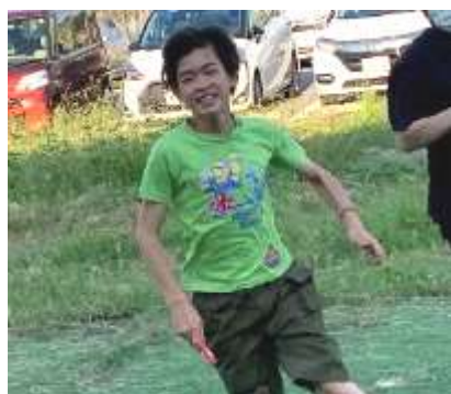
リレーで全力疾走