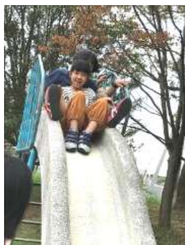
すべ だい 滑り台!