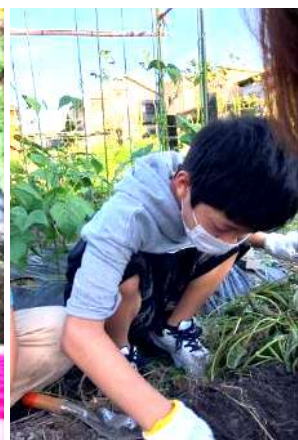
手でも掘ってみる...